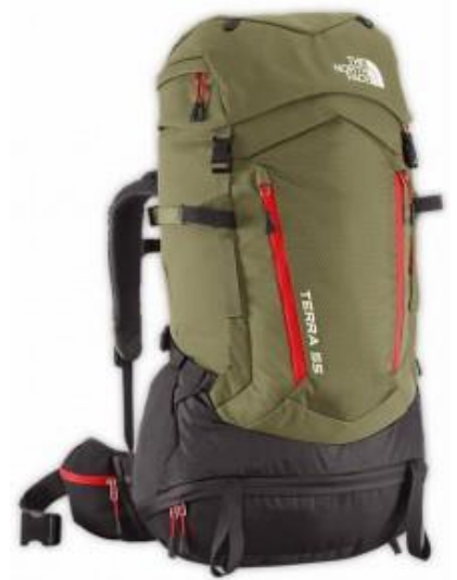
The North Face Youth Terra 55

The North Face Youth Terra 55 backpack is extremely popular among scouts as it does not only offer a lot of space but also great functionality for longer hiking or scouting trips. The backpack is made of very rugged nylon and thus offers great abrasion-resistance and durability. However, the durability and big volume comes for a price – this is the heaviest backpack in the review. The North Face Youth Terra 55 is equipped with an OptiFit harness that provides good comfort, load stability and adjustability for the age group 9 to 15 years (12 -16 inches in torso length). The backpanel consists of two heavily padded panels on the sides and an airflow channel between them. Due to this construction, the backpanel offers decent breathability. The shoulder straps and (fully adjustable) hip belt are like the backpanel heavily padded for maximum comfort. The main compartment offers great accessibility – it can be accessed from the top, through the zipper at the bottom or through the side zipper. This comes in handy when the backpack is fully loaded. In addition to the main compartment, the backpack also features a zippered stash pocket on the front side, zippered lid pocket, two zippered hip belt pockets and two side pockets for water bottles. The North Face Youth Terra 55 backpack is best for those who need a spacious and very rugged backpack for longer expeditions.