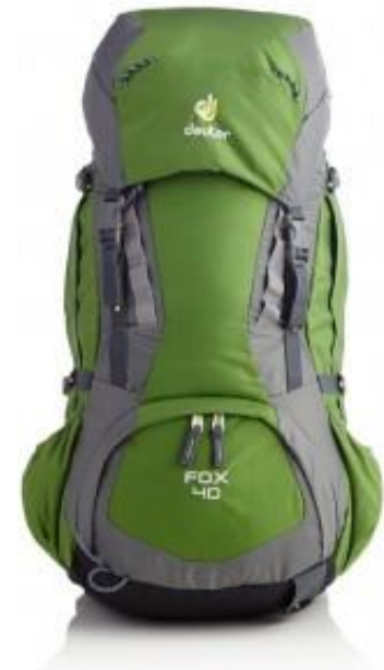
Deuter Fox 40 Kids

The Deuter Fox 40 Kids is a high-quality backpack suitable for two to three day long hiking or scouting trips and thus perfect for weekend expeditions. The backpack fits children and adolescents with a torso length from 11 to 18 inches (approx. 8-16 years) due to the super adjustable harness with a Velcro system. It is made of 600d polyester (Deuter Super Polytex) and 420d nylon (Deuter Ballistic) and therefore offers great abrasion resistance and durability. The fabrics also feature PU coating in order to provide basic protection against rain. The backpanel consists of two padded foam panels and an air channel between them. Behind the foam panels are two aluminum stays that ensure the stability of the backpack when carrying a heavy load. The shoulder straps and hip belt are made of breathable foam and thus provide good comfort. The hip belt can be also easily be removed in case that it is not needed – for example when the backpack is not filled with heavy items. In addition to that, the backpack features a spacious main compartment (can be accessed from the top as well as through zippered opening at the bottom), conveniently placed pockets and attachment points for ice axe and hiking poles. The Deuter Fox 40 Kids offers great performance and adjustability. Therefore, it is highly recommended for young outdoor enthusiasts.