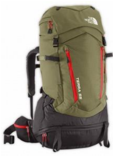
The North Face Youth Terra 55

This entry was posted in Backpacks and last updated on June 1, 2016 by Best Hiking