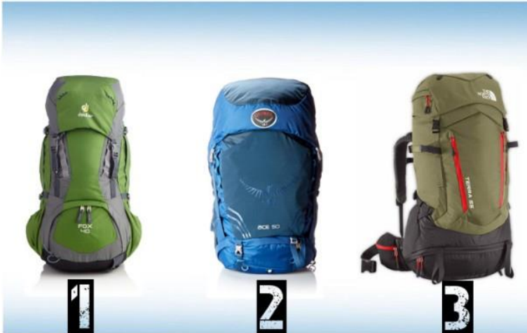
Best Backpacks for Kids