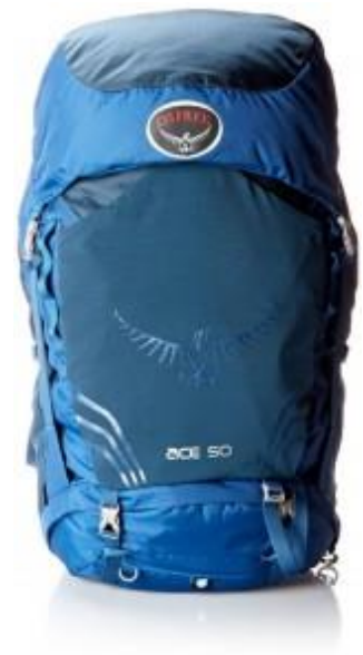
Osprey Ace 50 Youth